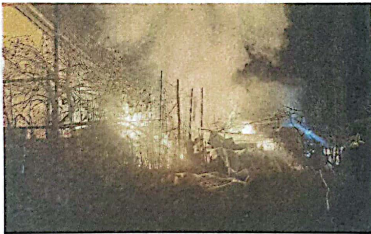
Il rogo. Per domare le fiamme i Vigili del fuoco hanno lavorato a lungo

Due famiglie sono così state costrette ad abbandonare la propria casa e hanno trovato riparo nelle vicinanze: con tutta