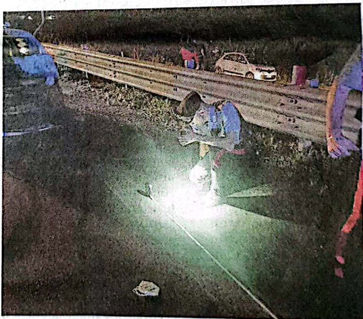
I rilievi dei carabinieri. Il luogo del pauroso incidente

to gravi ferite e sono stati trasportati in codice giallo all'ospedale di Chiari, dove il 43enne verrà sottoposto a tutti gli esami tossicologici previsti in questi casi. I referti saranno poi inviati al Civile per le analisi, come da prassi. Sul posto sono intervenuti